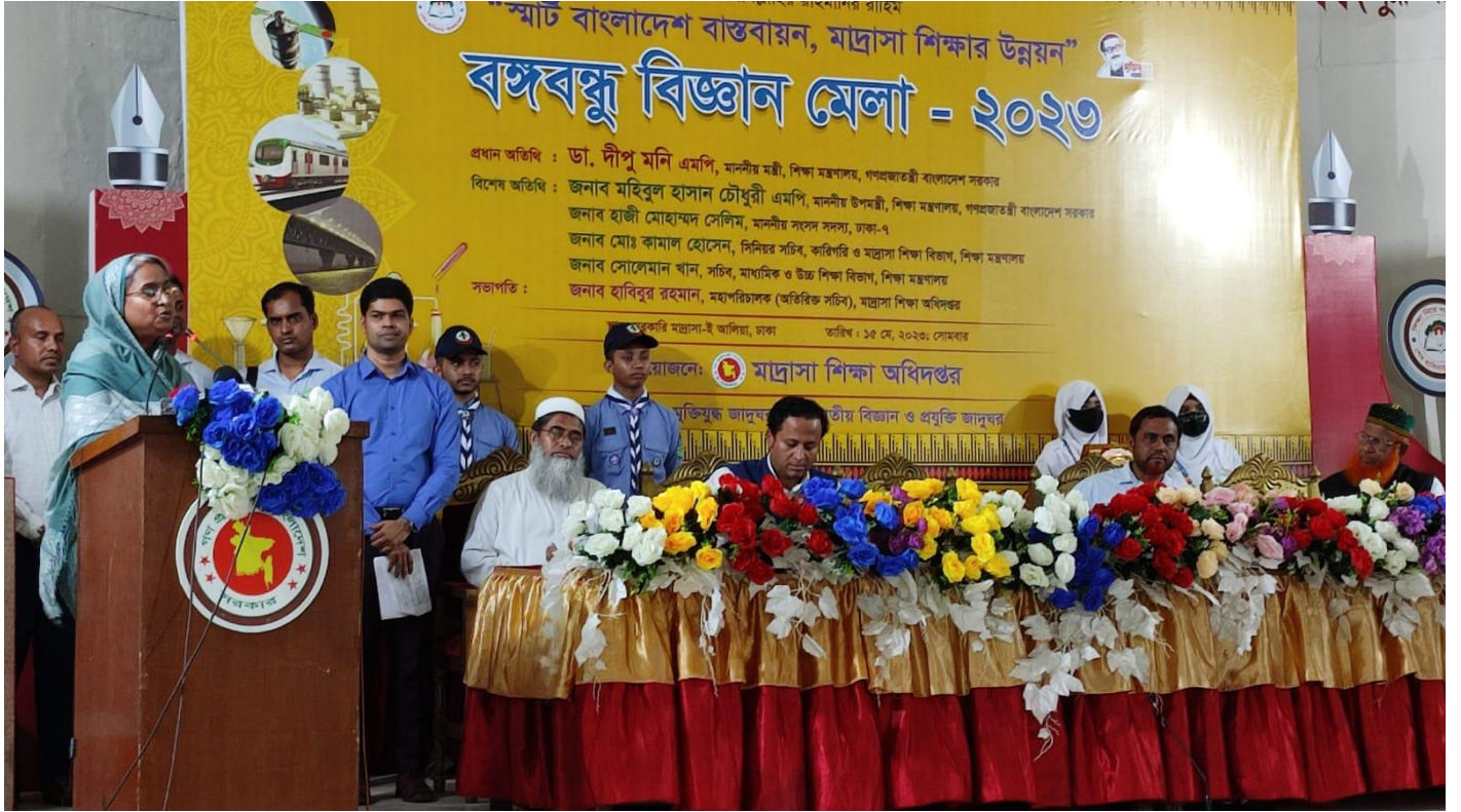
মাদ্রাসা শিক্ষা অধিদপ্তরের আয়োজনে বঙ্গবন্ধু বিজ্ঞান মেলা-২০২৩ এ মাননীয় শিক্ষা মন্ত্রীর বক্তব্য প্রদান