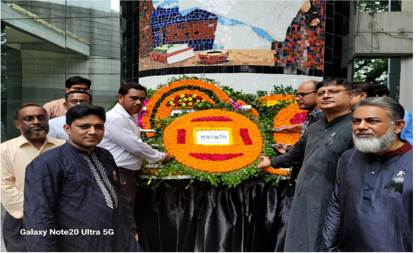
আর্ন্তজাতিক মাতৃভাষা ইন্সটিটিউটে জাতীয় শোক দিবসের শ্রদ্ধাঞ্জলি (১৫/০৮/২০২৩)